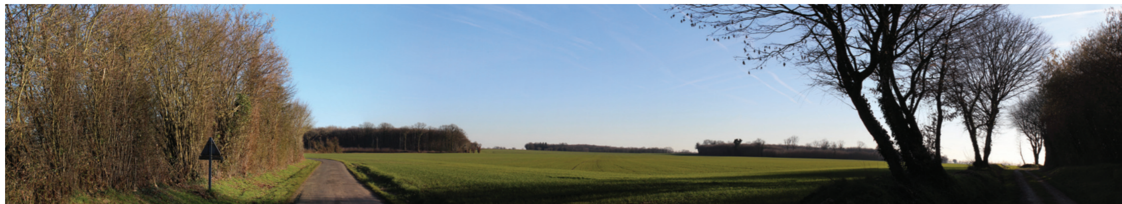
Vue panoramique de l'état initial (angle de vue 120°)