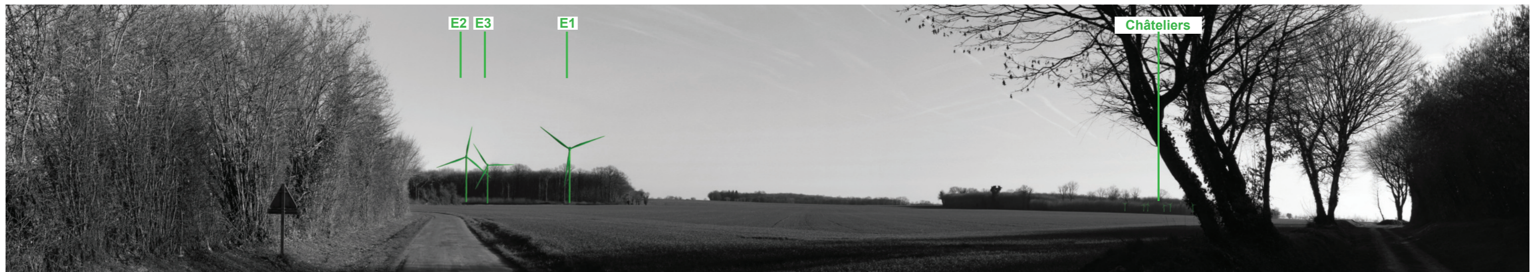
Vue panoramique noir et blanc avec esquisse du projet (angle de vue 120°)